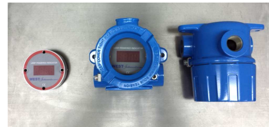
Cabeza a prueba de Explosión NEMA 7X con Ventana, con y sin Display

Ejemplo: Cabeza Nema 7x roscada en aluminio, conexión 1/2 npt x 1/2 npt a conduit. N/P: HXRAL-050050