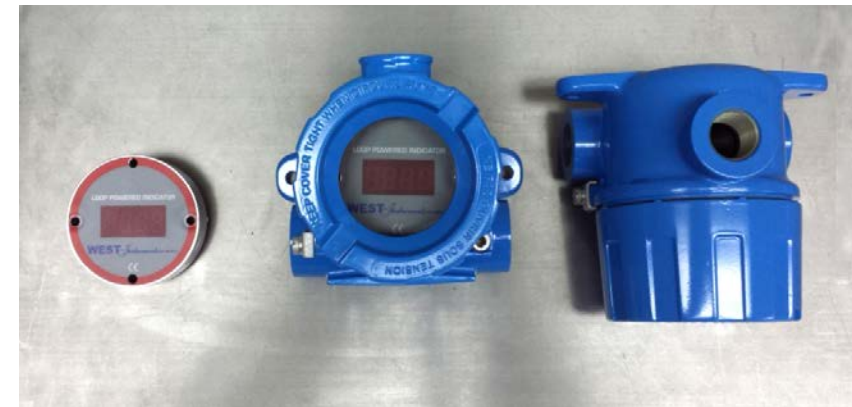
Cabeza a prueba de Explosión NEMA 7X con Ventana, con y sin Display

Ejemplo: Cabeza Nema 7x roscada en aluminio, conexión 1/2 npt x 1/2 npt a conduit. N/P: HXRAL-050050